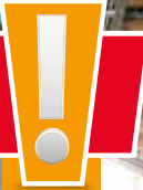
Strohmatic Air ASD