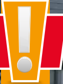
Manuálne podstielanie pomocou hadice