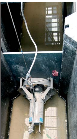
Detailný pohľad na pretlakové čerpadlo.