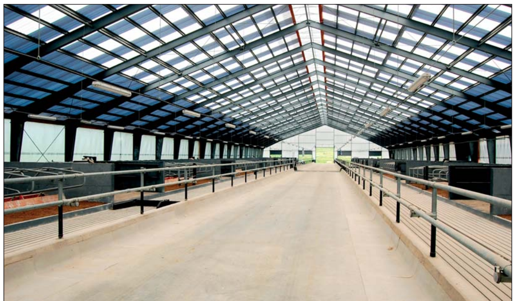
Celkový pohľad na kŕmnu chodbu novej maštale pre 720 dojníc.