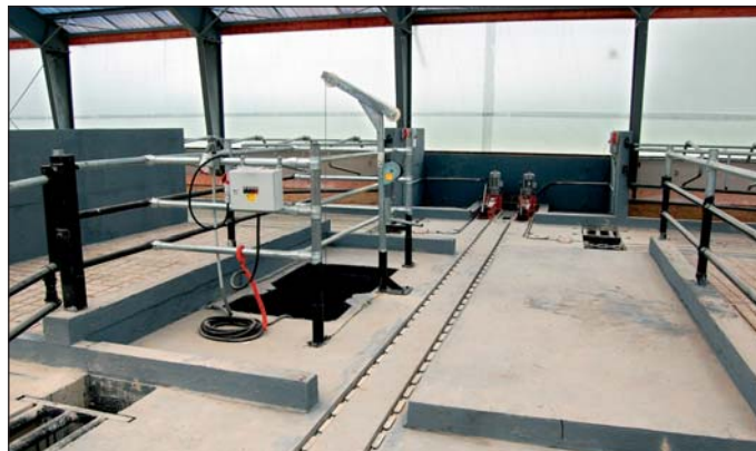
Stredová chodba s preronovým kanálom (vľavo vpredu), v ktorom je uložené pretlakové čerpadlo (vľavo v strede). V zadnej časti snímky je pohon reťazových zhŕňáčov exkrementov.

Ležiskové boxy sú vybavené novým druhom zábran (typ Komfort), ktoré nemajú zvislú nosnú