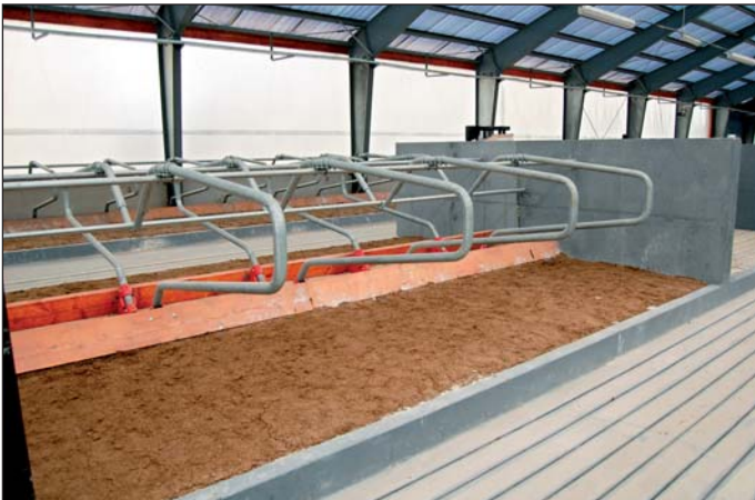
Ležiskové boxy typu Komfort.