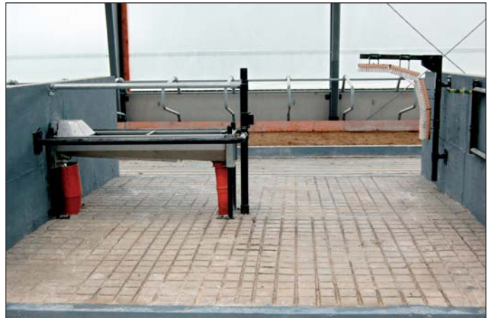
Dostatočne dimenzovaný priestor okolo napájačiek.

byť ustajňovacia kapacita farmy 2 500 jedincov HD.